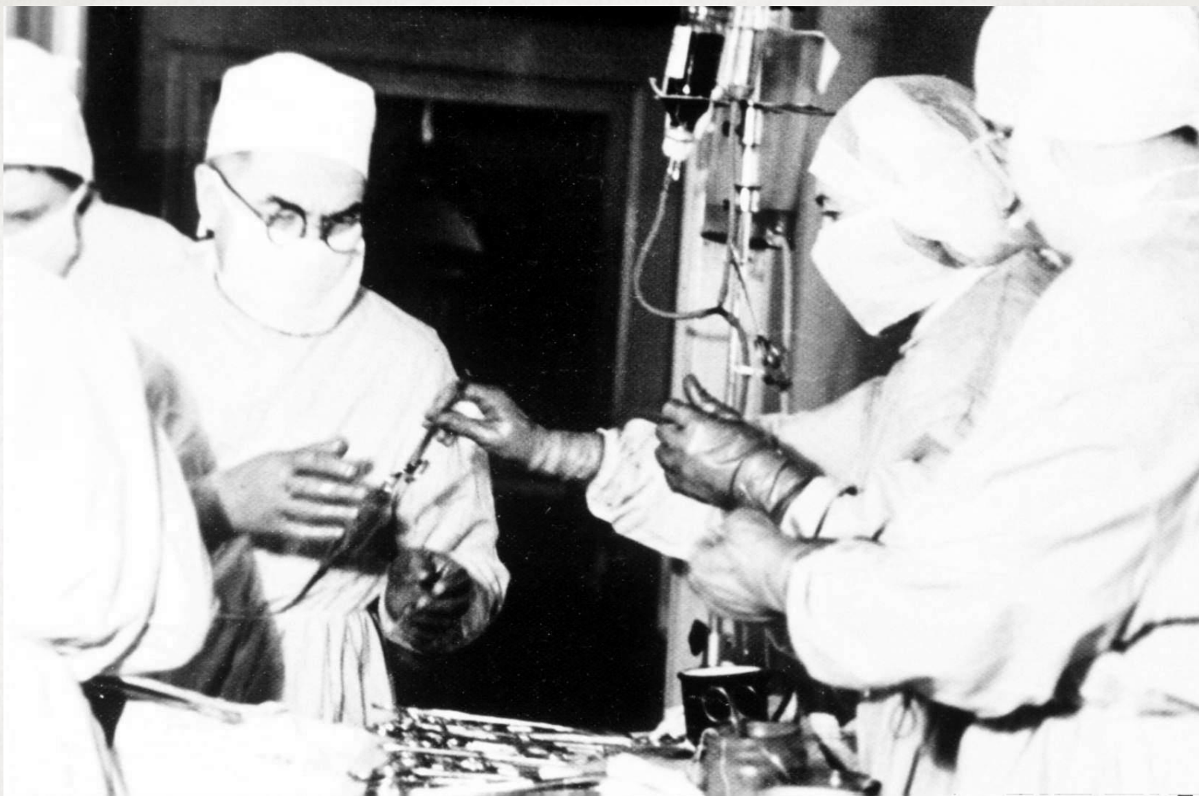
КЛИНИКА ОБЩЕЙ ХИРУРГИИ АГМИ (1981)