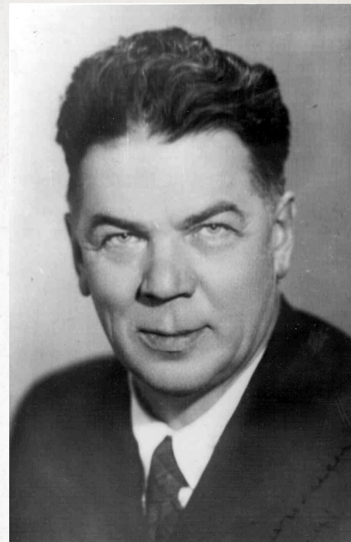
ПРОФ. Г.А. ОРЛОВ